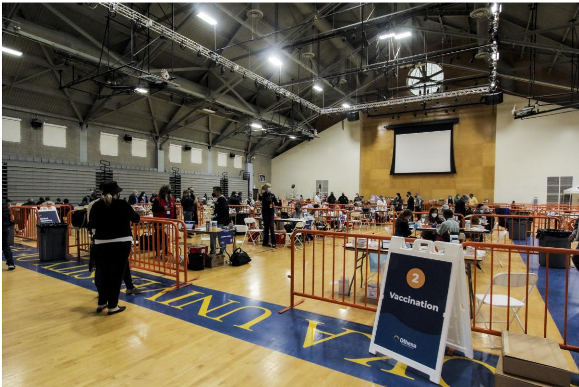
Hình: Tiêm chủng đang được tiến hành tại Đại học Soka, địa điểm Super POD mới nhất của OC