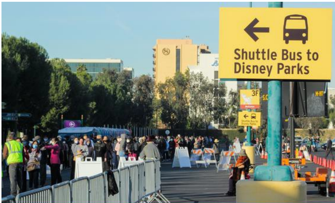
Hình: Cư dân quận Cam đang tiêm chủng COVID-19 tại địa điểm Super POD ở Disneyland